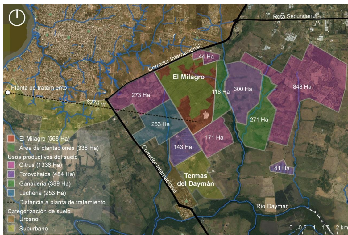
Figura N°3. Mapa de actividades productivas existentes en el entorno inmediato al PEM y distancia (m) a la Planta de tratamiento de aguas cloacales de OSE